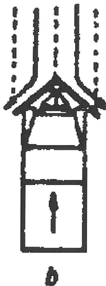
a - pługiem jednostronnym,