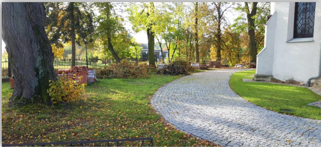
Fotografia 18. Parafia Rzymsko-Katolicka pw. Św. Prokopa w Klóbce - realizacja zadania remontowego pn. „Wykonanie drogi procesyjnej wokół kościoła- etap III.