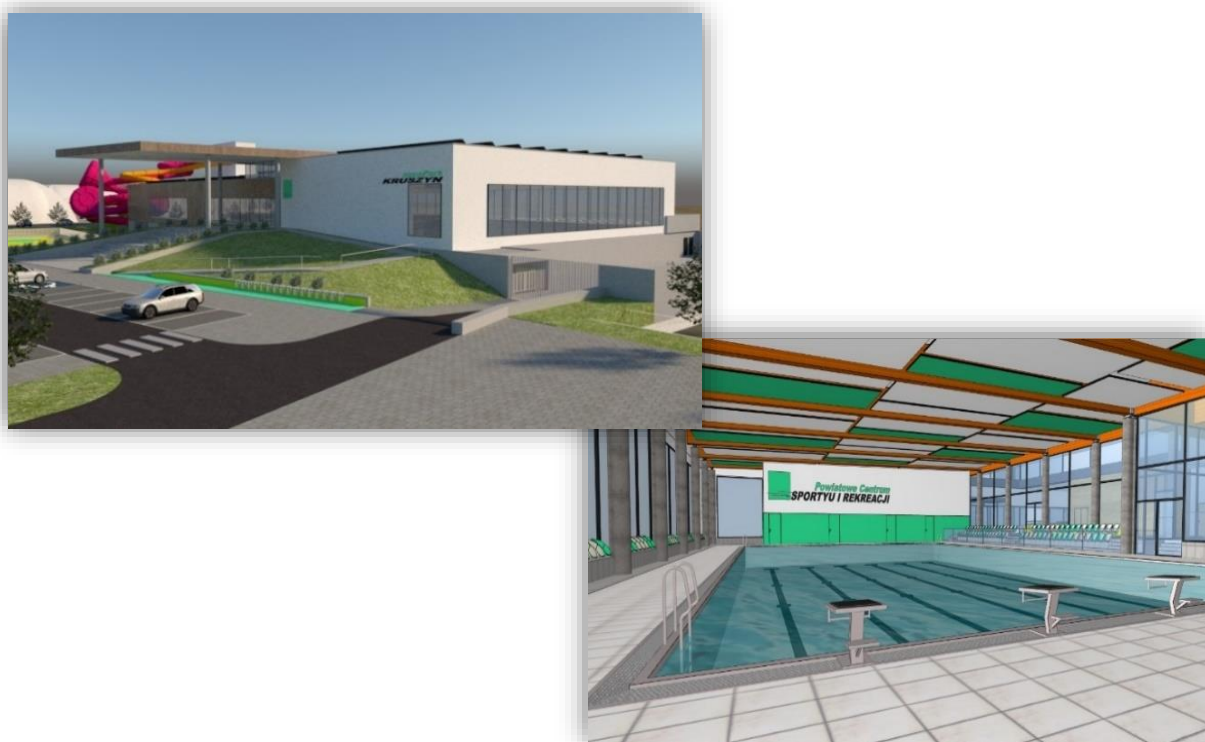
Fotografia 7. Wizualizacja Powiatowego Centrum Sportu i Rekreacji.