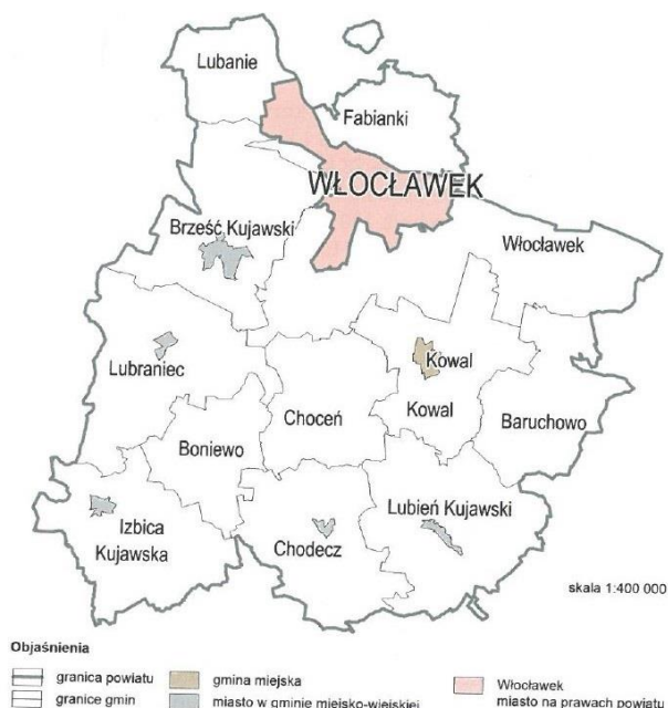
Rysunek 1. Podział administracyjny - Powiat Włocławski.

Dokument jest punktem wyjścia do debaty, w której udział wziąć mogą zarówno radni powiatowi jak i mieszkańcy powiatu włocławskiego na zasadach określonych w art. 30a ust. 7 i 8 ustawy o samorządzie powiatowym. Ponadto dokument będzie podstawą do udzielenia wotum zaufania dla Zarządu Powiatu we Włocławku.