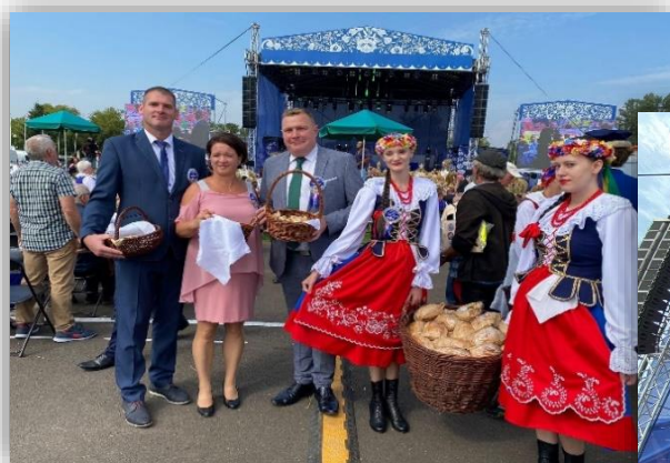
Fotografia 13. Fotorelacja z Dożynek Wojewódzkich.

Wydatki poniesione z budżetu powiatu wrocławskiego na organizację tego wydarzenia wyniosły 40.912,43 zł .