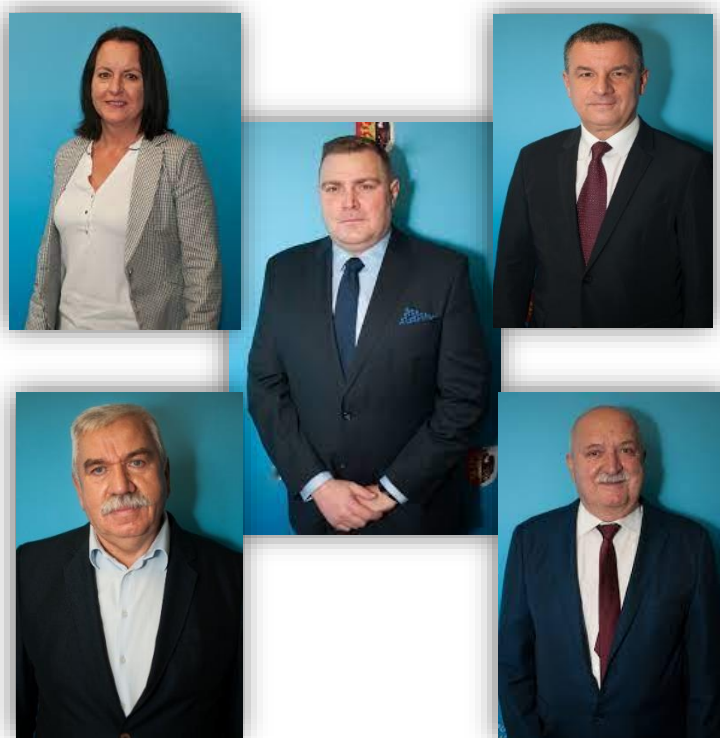
Fotografia 2. Członkowie Zarządu Powiatu we Włocławku.

Zarząd Powiatu we Włocławku w okresie objętym raportem tj. w okresie od 01.01.2022 r. do 31.12.2022 r. odbył 67 posiedzeń , w trakcie którym podjął 182 uchwały .