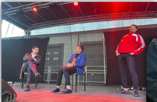
Fotografia 12. Fotorelacja z Powiatowego Pikniku Strażackiego.

Wydatki poniesione z budżetu powiatu na organizację imprezy wyniosły 124.236,20 zł .