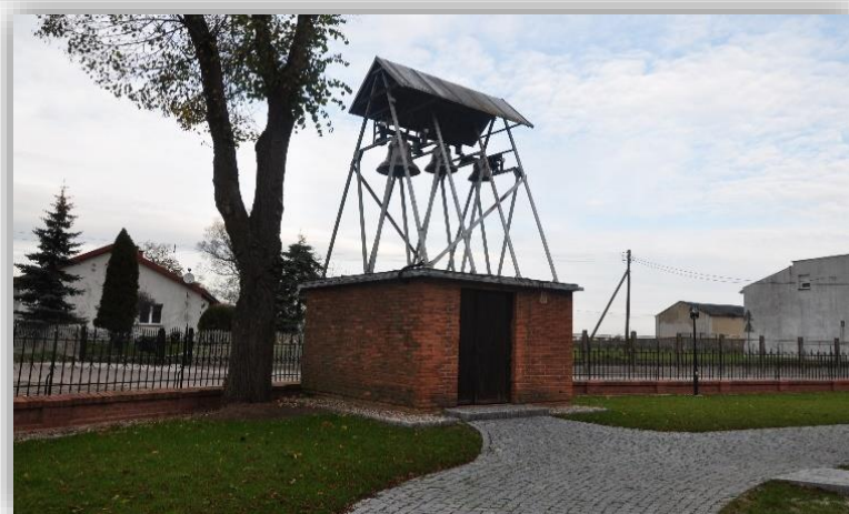
Fotografia 19. Parafia Rzymsko-Katolicka pw. Św. Dominika w Chodczu - realizacja zadania remontowego pn. Remont konserwatorski budynków cmentarnych w Chodczu.