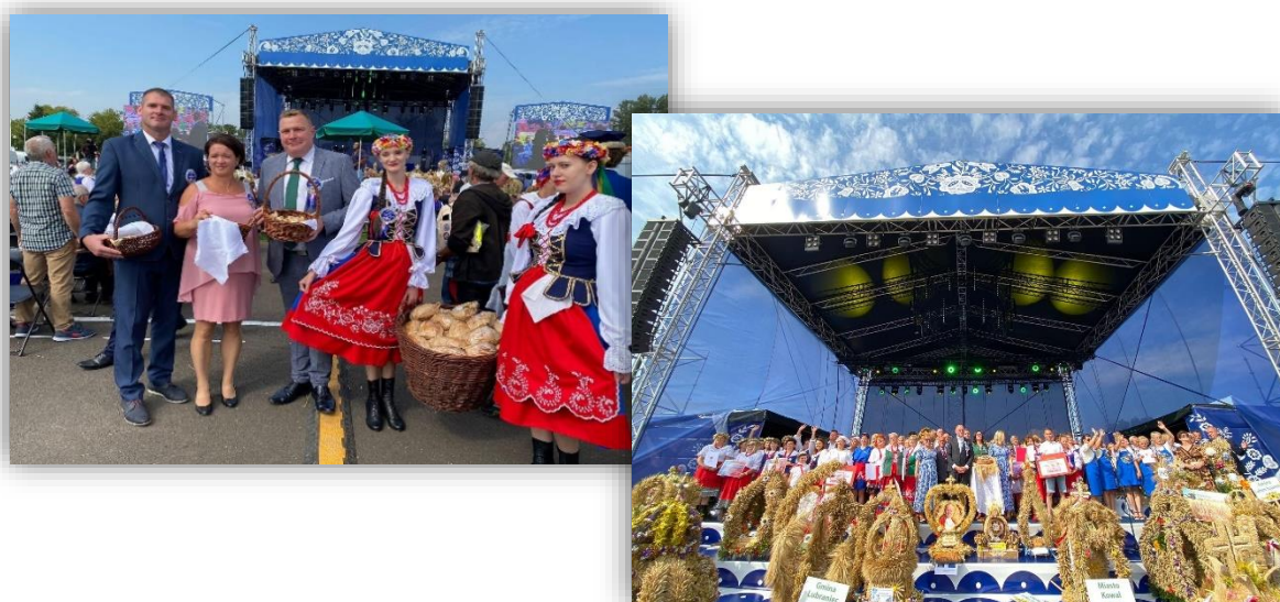
Fotografia 13. Fotorelacja z Dożynek Wojewódzkich.

Wydatki poniesione z budżetu powiatu wrocławskiego na organizację tego wydarzenia wyniosły 40.912,43 zł .