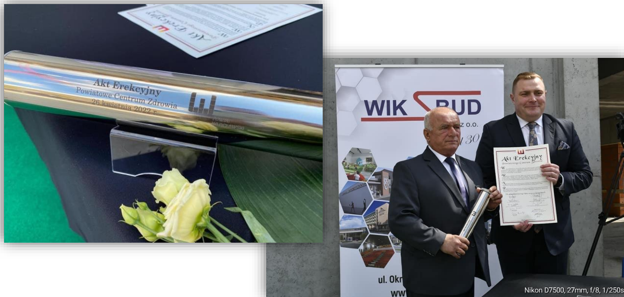
Fotografia. 4. Uroczystość podpisania aktu erekcyjnego pod budowę Powiatowego Centrum Zdrowia we Włocławku.