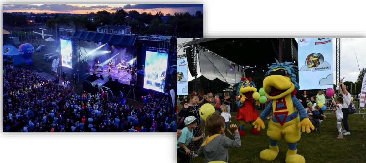
Fotografia 8. Fotorelacja z Święta Powiatu Włocławskiego.