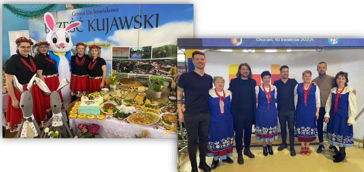
Fotografia 11. Fotorelacja z XXII Powiatowej Wystawy Stoły Wielkanocne na Kujawach w Izbicy Kujawskiej.

Wydatki poniesione z budżetu powiatu włocławskiego na organizację wystawy wyniosły 33.168,50 zł .