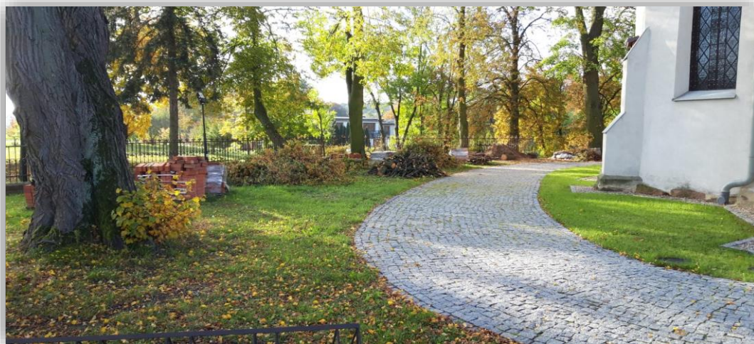
Fotografia 18. Parafia Rzymsko-Katolicka pw. Św. Prokopa w Klóbce - realizacja zadania remontowego pn. „Wykonanie drogi procesyjnej wokół kościoła- etap III.