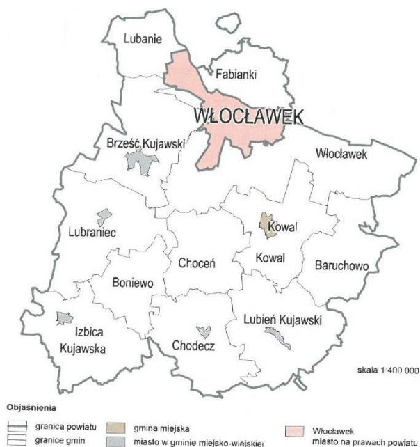
Rysunek 1. Podział administracyjny - Powiat Włocławski.

Dokument jest punktem wyjścia do debaty, w której udział wziąć mogą zarówno radni powiatowi jak i mieszkańcy powiatu włocławskiego na zasadach określonych w art. 30a ust. 7 i 8 ustawy o samorządzie powiatowym. Ponadto dokument będzie podstawą do udzielenia wotum zaufania dla Zarządu Powiatu we Włocławku.