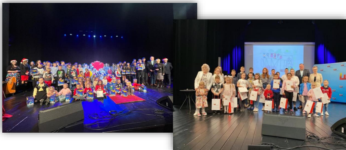
Fotografia 15. Fotorelacja z VII Powiatowego Dnia Dziecka i Rodzicielstwa Zastępczego.

W trakcie roku odbyły się spotkania z dziećmi pozostającymi w rodzinnej i instytucjonalnej pieczy zastępczej z terenu powiatu włocławskiego. W dniu 28 maja 2022 r. odbył się VII Powiatowy Dzień Dziecka i Rodzicielstwa Zastępczego , a w dniu 3 grudnia spotkanie świąteczne. Oba wydarzenia miały miejsce w Brzeskim Centrum Kultury i Historii Wahadło w Brześciu Kujawskim. Łączny koszt organizacji tych wydarzeń wyniósł 19.001,67 zł.