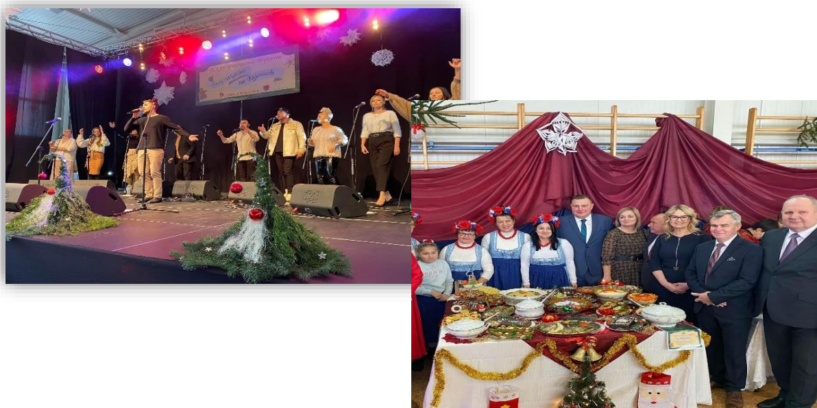
Fotografia 14. Fotorelacja z XXII Powiatowa Wystawa Stoły Wigilijne na Kujawach.

W trakcie roku odbyły się spotkania z dziećmi pozostającymi w rodzinnej i instytucjonalnej pieczy zastępczej z terenu powiatu włocławskiego. W dniu 28 maja 2022 r. odbył się VII Powiatowy Dzień Dziecka i Rodzicielstwa Zastępczego , a w dniu 3 grudnia spotkanie świąteczne. Oba wydarzenia miały miejsce w Brzeskim Centrum Kultury i Historii Wahadło w Brześciu Kujawskim. Łączny koszt organizacji tych wydarzeń wyniósł 19.001,67 zł.