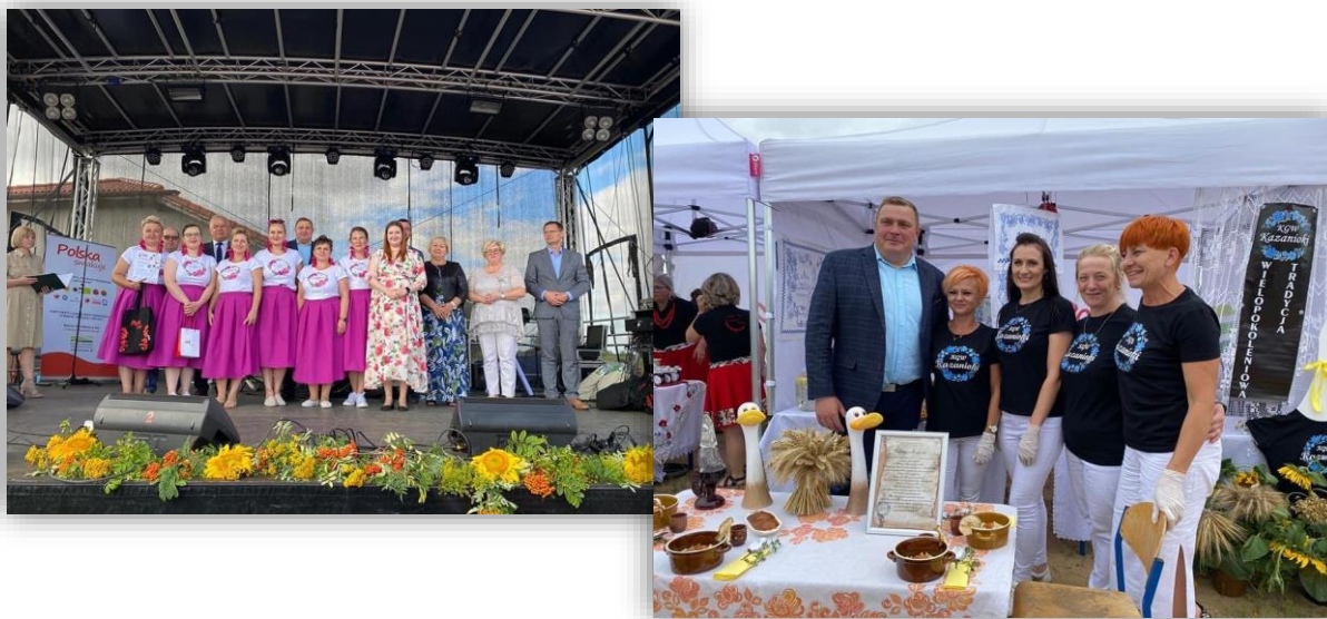
Fotografia 9. Fotorelacja z Festiwalu Smaków.

3. Powiatowy Dzień Kobiet 2022 r. – koncert odbył się w dniu 12 marca 2022 roku w Hali Mistrzów we Włocławku. Uczestniczyło w nim ok. 3 tys. mieszkanek powiatu. Wystąpiła Alicja Majewska z Włodzimierzem Korczem oraz Andrzej Piaseczny z zespołem.