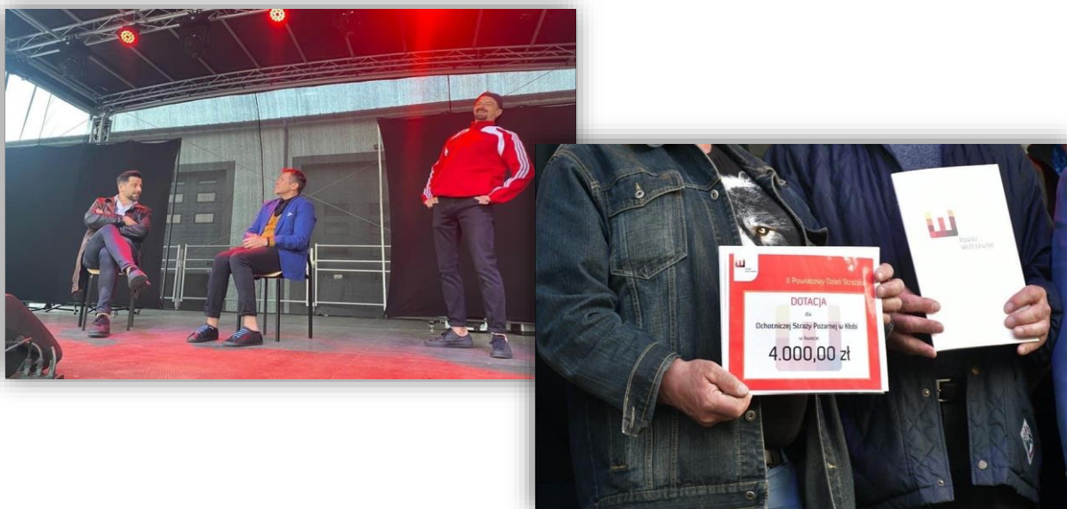
Fotografia 12. Fotorelacja z Powiatowego Pikniku Strażackiego.

6. Dożynki Wojewódzkie 2022 , które odbyły się w dniu 28 sierpnia 2022 r. na terenie lotniska aeroklubu wrocławskiego w Kruszynie. Powiat Wrocławski był jednym ze współorganizatorów.