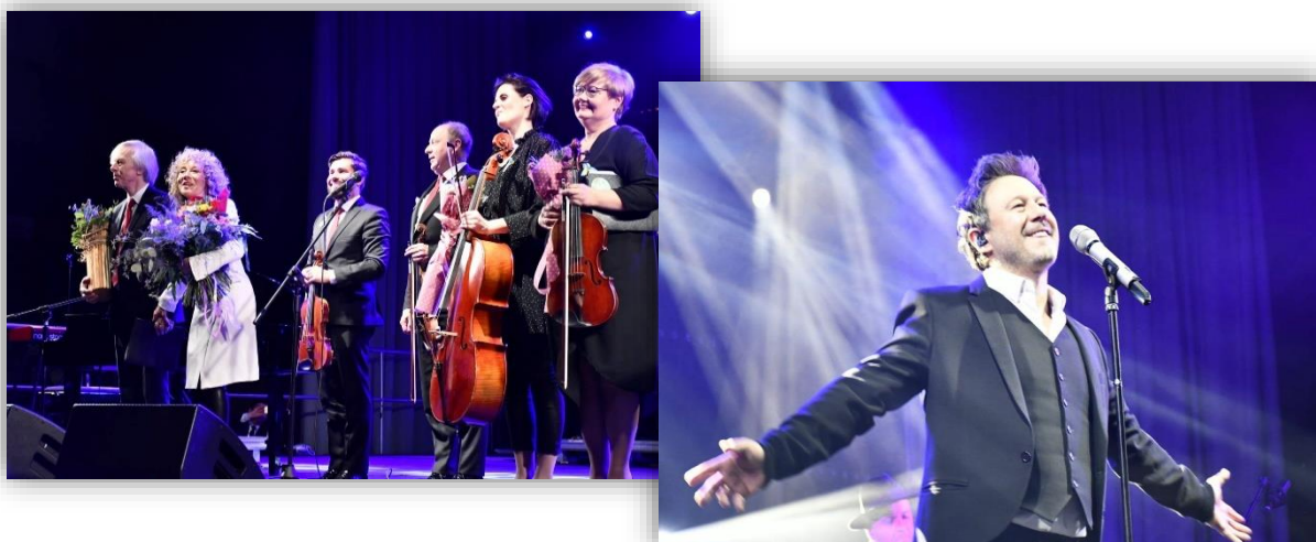
Fotografia 10. Fotorelacja z Powiatowego Dnia Kobiet.

Wydatki poniesione z budżetu powiatu na organizację imprezy wyniosły 192.799,65 zł.